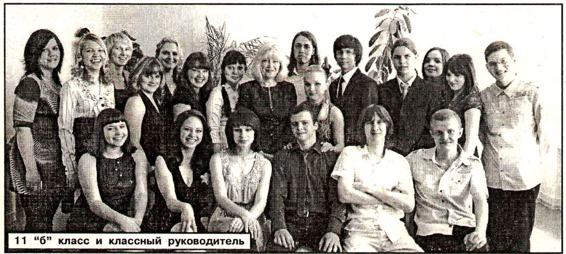
11 «б» класс и классный руководитель