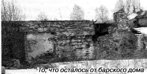
То, что осталось от барского дома