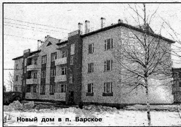
Новый дом в п. Барское

А недавно в «Авроре» произошло событие, о котором можно только мечтать.