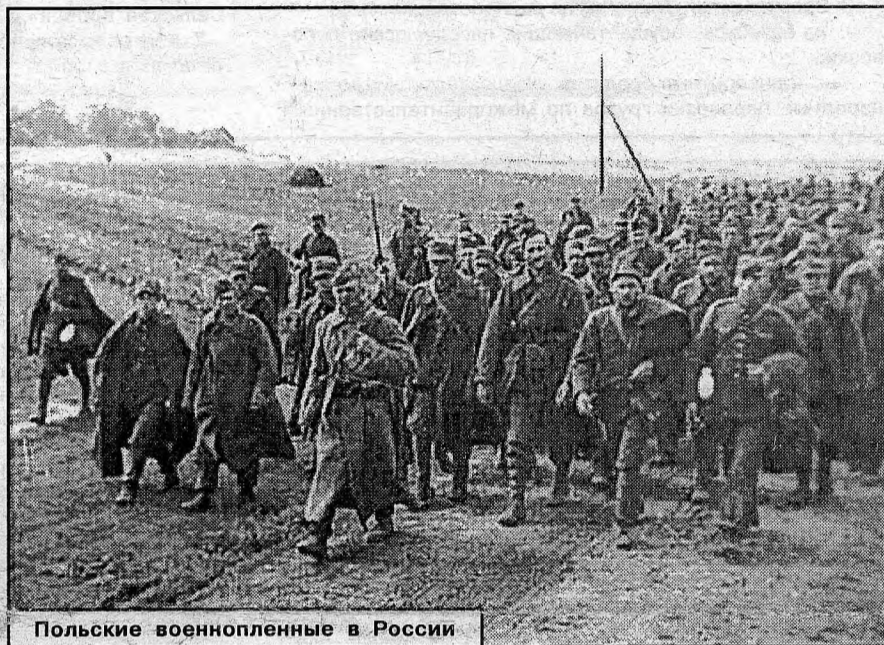
Польские военнопленные в России

Наблюдается безобразное поведение французов - неподчинение часовым, подход к проволоке, на окрики и требования бойцов на посту отвечают криками, насмешками и руганью. 5 июля одним из часовых был сделан предупредительный выстрел, т. к. военнопленный просовывал голову в проволочное заграждение. Следует попутно отметить, что не только французы, но и весь прибывший контингент крайне обозлен ввиду грубостей, проявленных конвоем в пути.