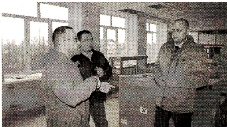
Глава района дал поручение уточнить все разногласия между проектом и сметной документацией

На сегодняшний день в средней школе № 2 продолжают электротехнические работы: