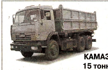
КАМАЗ 15 ТОНН

ПРИВЕЗУ НАВОЗ, ПЕСОК, ЗЕМЛЮ, ПЕРЕГНОЙ, ДРОВА 8-911-535-57-07