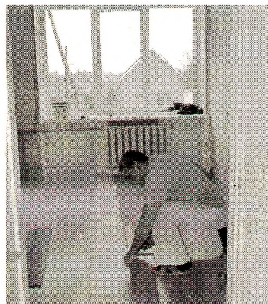
Внутренняя отделка помещений в здании ГСШ № 2

В здании школы искусств г. Грязовца ремонт кровли завершен. Рабочие за счет собственных