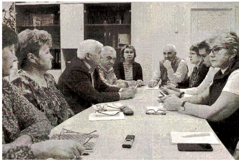
Встреча инициативной группы в редакции газеты

Комсомольцы - люди деятельные, поэтому предложений озвучили множество. Решили, что мероприятие будет постро-