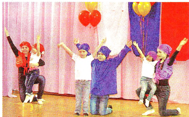
Выступление детей сопровождалось бурей аплодисментов.

25 марта состоялся уже третий по счету районный фестиваль творчества детей, воспитывающихся в замещающих семьях, - «Крылатые качели». Год от года растет его популярность, пополняются ряды «артистов». Неизменным остается лишь желание всех детей быть любимыми и счастливыми в семье. Именно это звучит в репертуаре выбранных ими произведений, в спетых ими песнях и рассказанных стихах, в искренних нотках голоса, доверчивых глазах, желании выразить благодарность самым близким людям.