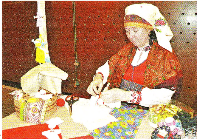
Мастер-классы по изготовлению оберегов и сувениров.

- Атмосфера очень приятная. С каждым годом Праздник труда становится все лучше и современнее. Приятно видеть, как награждают людей рабочих профессий, сельских тружеников, чувствуют коллективы. Все красиво, торжественно, настроение замечательное. Думаю, что все присутствующие сейчас испытывают гордость за свой район и его жителей.