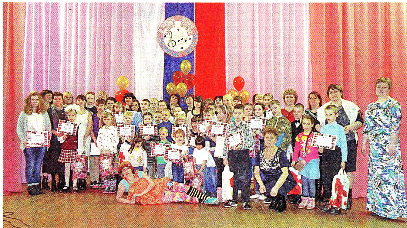
Год от года растёт популярность фестиваля «Крылатые качели».