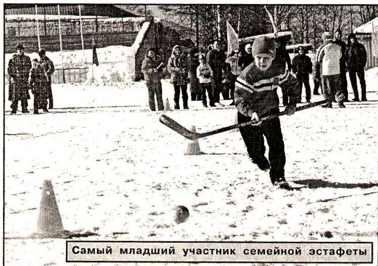
Самый младший участник семейной эстафеты