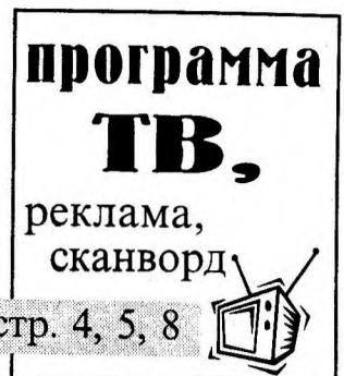
стр. 4, 5, 8