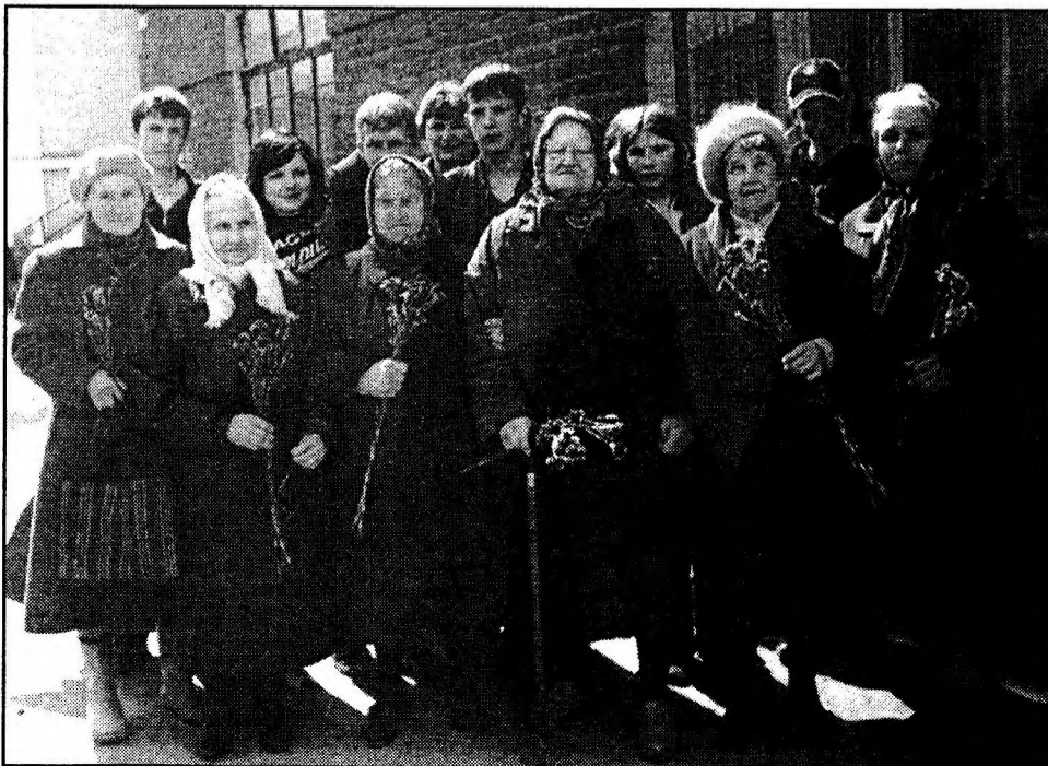
Члены краеведческого кружка с ветеранами войны и труда у здания, где во время войны располагался эвакогоспиталь.