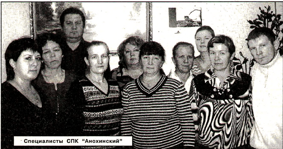
Специалисты СПК «Анохинский»

вые технологии, - говорит руководитель. - Хотя многие из них в других хозяйствах района стали давно привычным делом. Планируем строительство нового комплекса на 500 голов, постепенно переходим на современную форму кормления молодняка. В планах, конечно, увеличить поголовье скота. Чтобы нормально развиваться, нужно увеличить дойное стадо с 450 до 1000 голов. Мы столкнулись с тем, что у нас очень низок коэффициент использования кормов: черно-пестрая порода устарела, будем занимать-