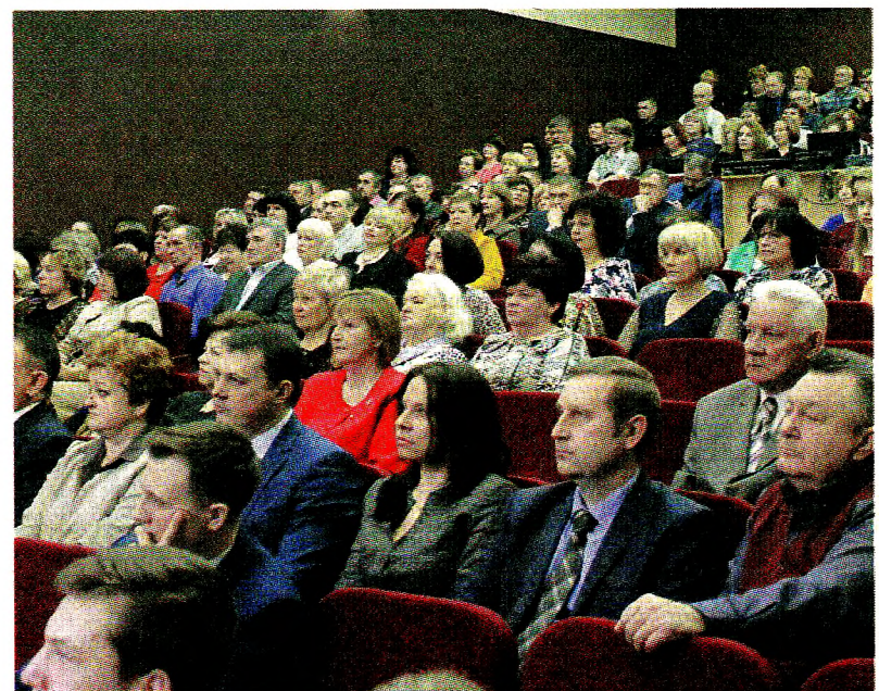
В зале районного Дома культуры собрались грязовчане самых разных профессий и поколений