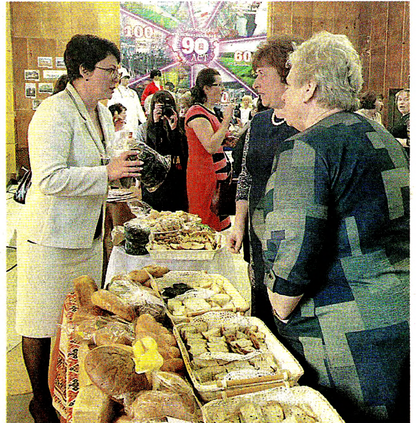
Во время торжества работала выставка «Настоящий Вологодский продукт». Под этой маркой выпускается около 4 тысяч наименований продукции. Товары поставляются в 60 регионов России и 11 стран ближнего и дальнего Зарубежья