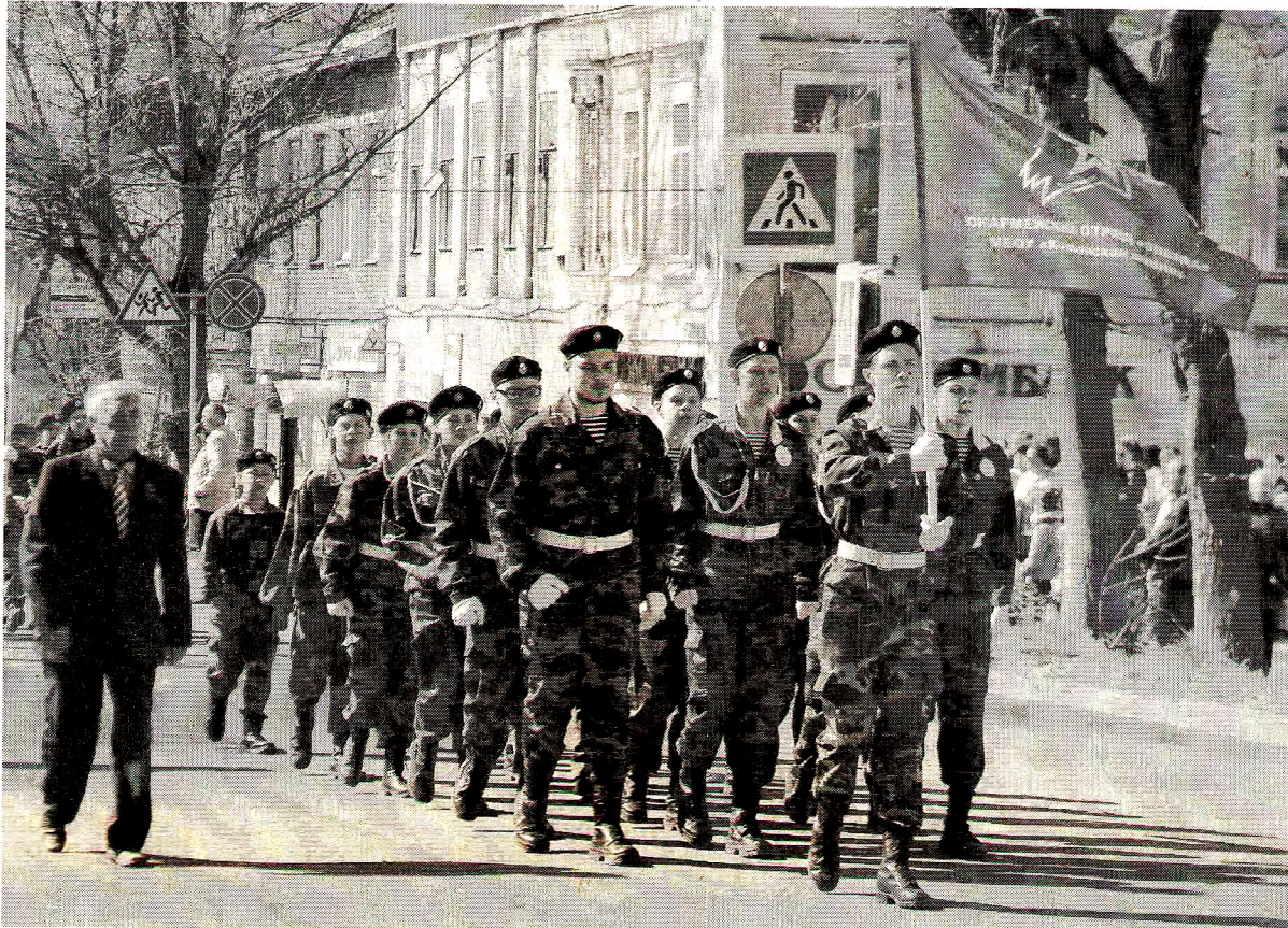
Рейтинг юнармейских отрядов Грязовецкого района за февраль 2019 года: 1 место - отряд «Звезда» МБОУ «Комьянская школа», 2 место - отряд «Служу России» МБОУ «Ростиловская школа», 3 место - отряд «СОБР» МБОУ «Сидоровская школа». 9 мая 2018 года.

- Юнармия воспитывает готовность к самоотверженному служению обществу и государству, укрепляет здоровье, готовит юношей к службе в армии, развивает физические, духовные и нравственные качества личности, - уверен руководитель отряда «Собр» Сидоровской