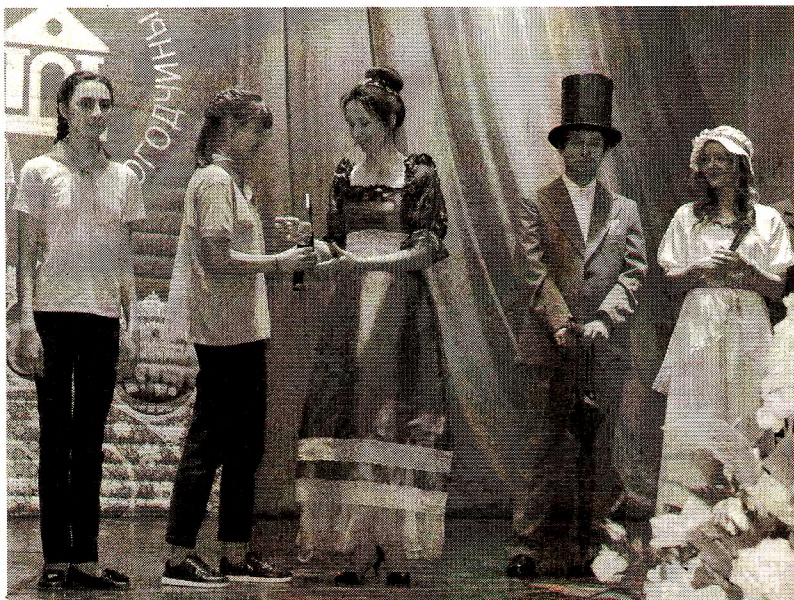
От волонтеров к театралам: церемония передачи символа года