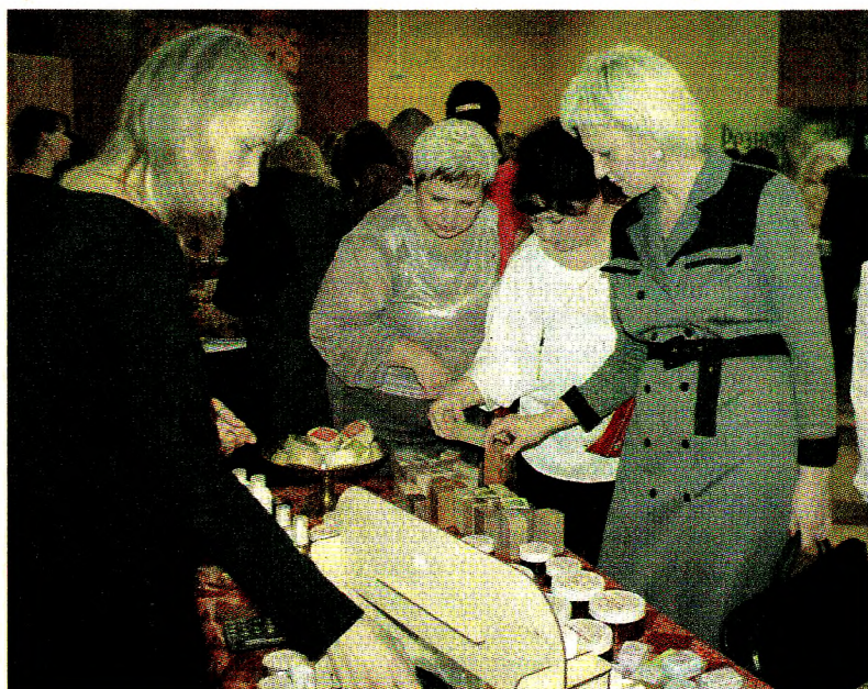
Лучшие образцы своей продукции представили передовые перерабатывающие предприятия Грязовецкого района, а также гости из Кирилловского, Шекснинского районов и города Вологды