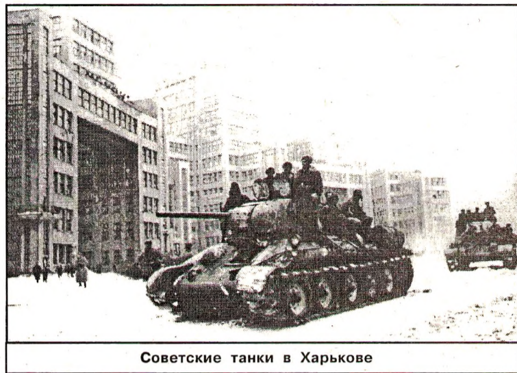
Советские танки в Харькове

Впервые с городом я познакомился, когда учился в Грязовецком техникуме механизации и электрификации сельского хозяйства в 1986-