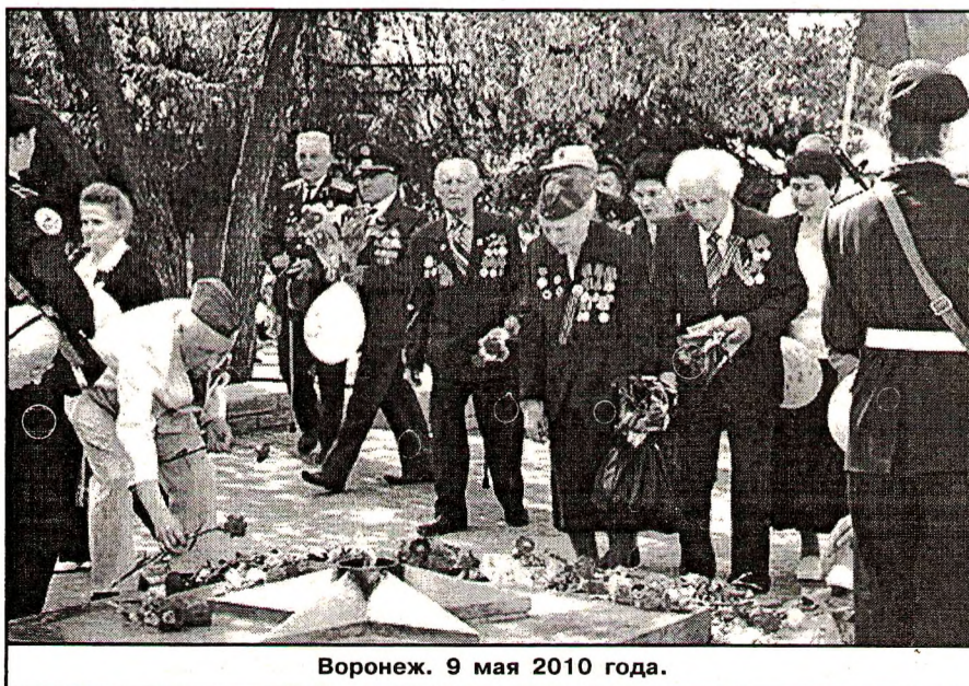
Воронеж. 9 мая 2010 года.