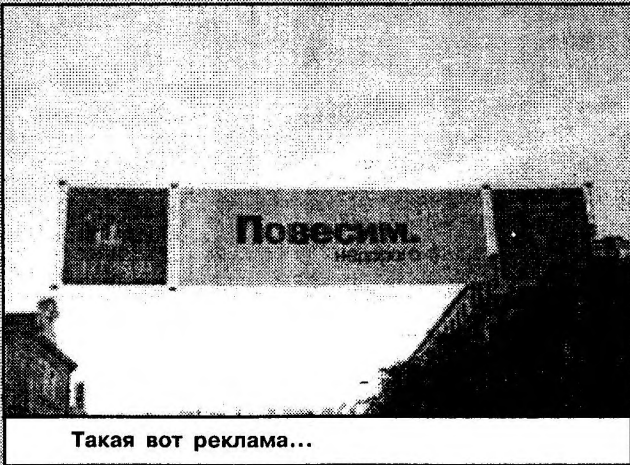
Такая вот реклама...