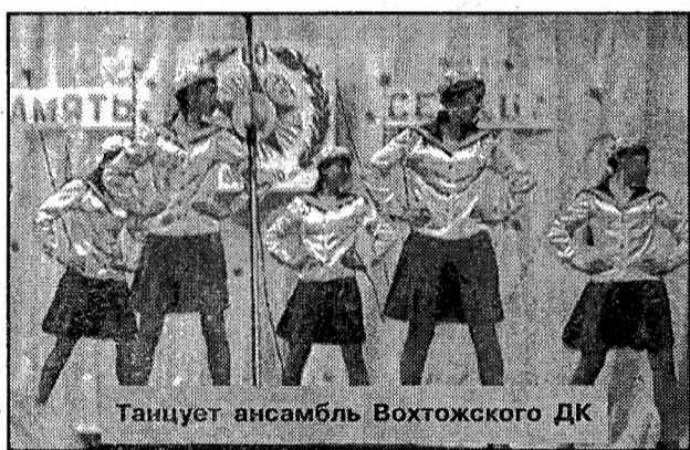
Танцует ансамбль Вохтожского ДК