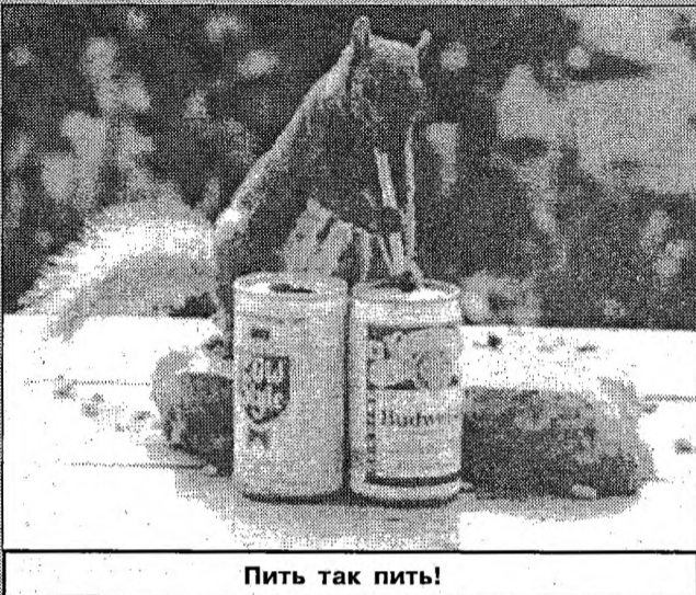
Пить так пить!

Известный документалист Леонид Парфенов, который тоже собирается работать в документальном жанре на Первом (разумеется, не в одной команде с Сорокиной), в свои ближайшие рабочие планы пока никого не посвятил.