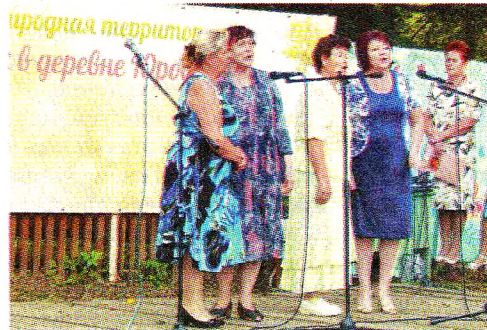
Более 15 коллективов продемонстрировали свои таланты

Думаю, что разговоры в Юрове и сам праздник найдут достойное место в новой книге, которая, надеюсь, выйдет уже в октябре этого года».