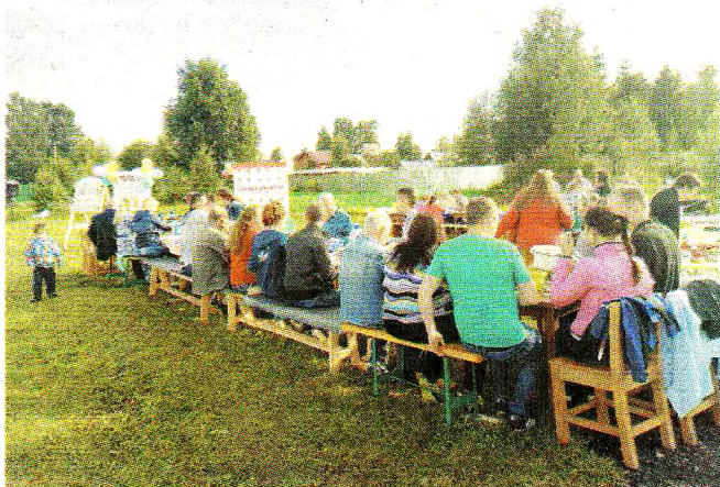
Более ста человек присутствовали на празднике