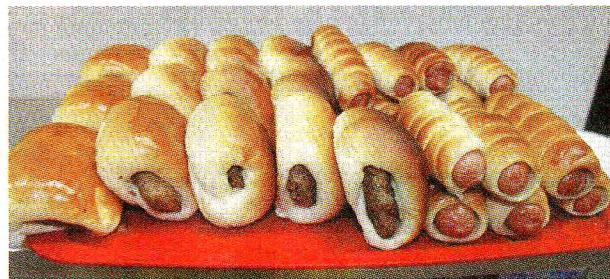
Всегда в наличии свежая домашняя выпечка