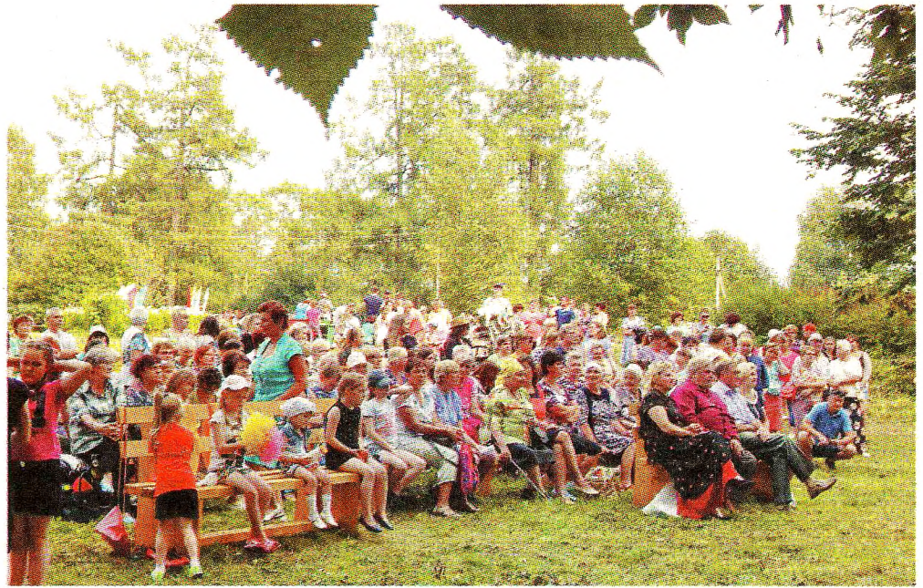
Зрители наслаждались прекрасными песнями, замечательной музыкой и зажигательными танцами