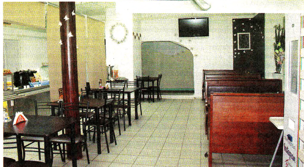
Зал кафе просторный и позволяет свободно разместиться каждому посетителю