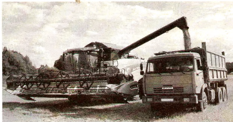
«Зерно созрело, если еще ждать, то можно все потерять»

В этом году из-за погодных условий уборка зерновых культур началась почти на месяц позже.