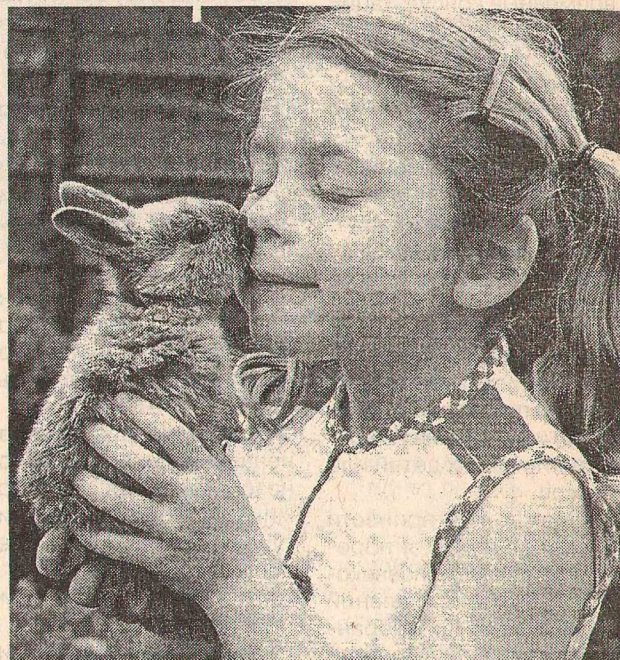
Я тебя люблю...

От высокого кровяного давления нас спасают домашние животные: кошки, собаки и птицы. Эту житейскую истину подтвердили исследования ученых. Изучалась группа из 6 тысяч человек в возрасте от 20 до 60 лет. Общение с домашним любимцем так же полезно, как гимнастика и вегетарианская диета. Ученые констатировали даже снижение уровня холестерина в крови. «Немецкая медицинская газета» сообщает, что пока не найдено научного обоснования этого явления. Предполагается воздействие на мозг и гормональную систему какого-то духовного фактора.